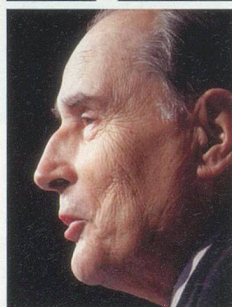
Président de la République française, le très sérieux François Mitterrand (1916-1996) s'entretenait régulièrement avec l'astrologue Elisabeth Teissier.