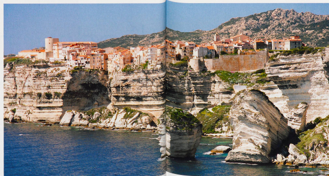
Bonifacio est sans conteste la ville la plus célèbre de Corse mais également la plus atypique. En effet, alors que le reste de l'île est constitué essentiellement de granit, la ville située à l'extrême sud repose sur une falaise de calcaire.

guano. C'est aussi au départ de Bonifacio que l'on rejoint en bateau l'archipel des Lavezzi, situé à 10 km au large. Cette réserve naturelle offre un décor fait d'amas rocheux multiformes, de petites criques de sable fin et de grandes plages «tropicales». Elle est aussi parcourue de multiples sentiers de randonnée qui cheminent à travers le maquis. De quoi séduire les promeneurs, les plaisanciers, les plongeurs et les adeptes du bronzage.