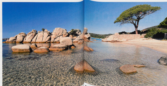
Au sud, la plage de Palombaggia est considérée comme une des plus belles de tout le territoire. L'eau y est d'une limpidité rare et le sable blanc invite à de longues séances de bronzage.

bles plages se succèdent sur environ 50 km. La plus belle et la plus sauvage est sans conteste Rondinara, même si l'on retrouve ce sable et ces eaux claires dans les autres baies de la région, comme par exemple à Palombaggia, bordée de pins parasols et de genévriers, et parsemée de rochers. Et toujours avec pour toile de fond quelques-uns des plus beaux sites montagneux de l'île, à l'instar de L'Ospedale et ses allures de parc américain. La Corse, c'est un confetti de près de 8700 km 2 posé sur la Méditerranée. Une subtile combinaison d'austérité et de plaisir, avec cet envoi parfum d'île lointaine... Frédéric Rein