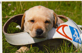
Les chiots restent neuf semaines avec leur mère: une période de développement très importante pour leur avenir.

Pour en savoir plus, tél. 021 905 60 95 et www.chienguide.ch