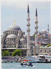
La Nouvelle mosquée d'Istanbul... s.a.f

Qui ne rêve pas de découvrir les fascinantes statues géantes du mont Nemrod, les décors lunaires de la Cappadoce et Istanbul? Profitez de notre offre en page 86.