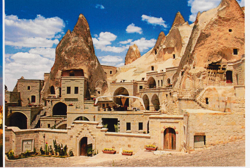
Göreme, un village troglodytique sculpté par le vent, l'eau et l'homme. Valery Kraynov

merveilles du monde? Tout simplement parce qu'il n'a jamais été cité dans les sources antiques. C'est en 1881 seulement qu'un ingénieur allemand, Karl Sester, sortit par hasard Nemrut Dag de l'oubli. Les fouilles commencèrent en 1953 et, en 1987, le site a logiquement été inscrit sur la liste du patrimoine mondial de l'UNESCO.