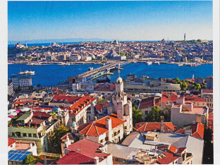
Vue sur l'estuaire de la Corne d'Or. Sator

de milliers de chats, qui sortent après la prière de 17 h, en même temps que les ordures, dans lesquelles ils cherchent leur nourriture! Dans cette ville fondée sur sept collines, l'animation est de tous les instants, le bruit aussi. A l'instar des 4000 boutiques du Grand Bazar, où les loukoums côtoient aussi bien les épices que les banques. A Istanbul, les doux parfums de l'Orient ne sont jamais bien loin... F. R.