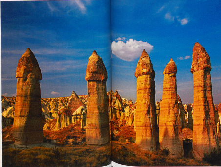
Dans la vallée de l'Amour se dressent d'immenses pierres en forme de pénis. Hercules Kottikas