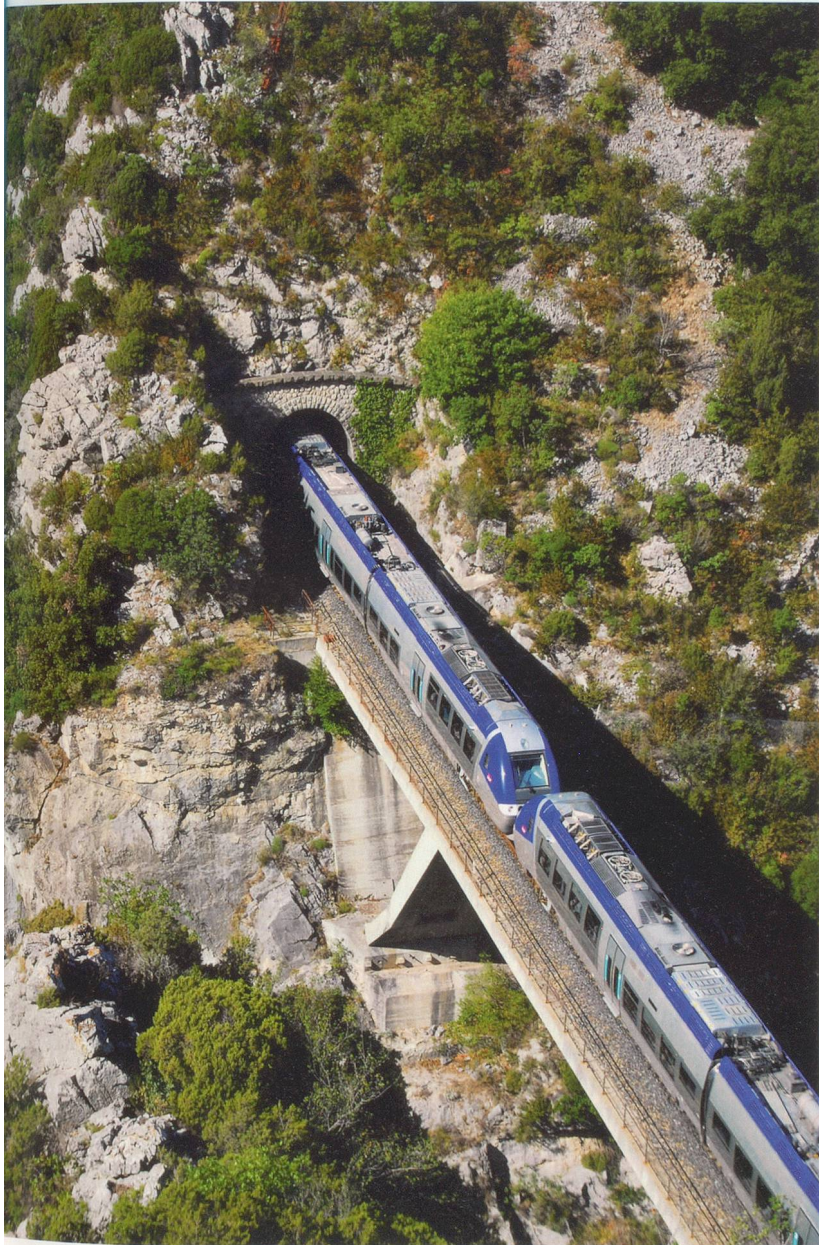
Sur la ligne du col de Tende, le «train des merveilles» emprunte des ouvrages spectaculaires qui raviront les passagers.