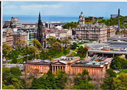
Edimbourg offre le visage harmonieux d'une vieille ville, dominée par une forteresse médiévale, et d'une ville nouvelle néoclassique.