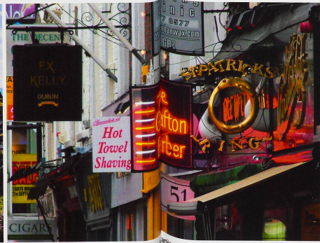
La rue piétonne de Grafton est l'une des plus importantes artères commerçantes de Dublin.