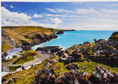
Considérée comme l'un des plus beaux coins de la côte des Cornouailles, la crique de Kynance Cove devenue populaire au début de l'époque victorienne.