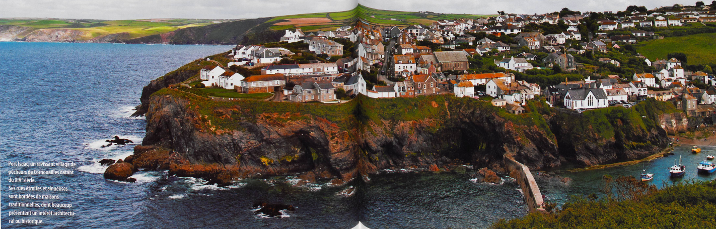
Port Isaac, un ravissant village de pêcheurs de Cornouailles datant du XIV e siècle. Ses rues étroites et sinueuses sont bordées de maisons traditionnelles, dont beaucoup présentent un intérêt architectural ou historique.