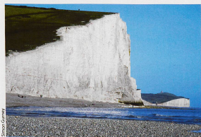
Les falaises de craie, près d'Eastbourne dans le sud de l'Angleterre, méritent le détour.