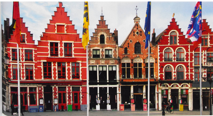
Ville d'art comprenant de nombreux musées, Bruges se devait aussi de présenter des trésors à ciel ouvert comme ces demeures d'époque aux façades colorées.

Il règne une atmosphère spéciale à Bruges. Pour visiter la Venise du Nord et le plat pays, voir notre offre en page 86.