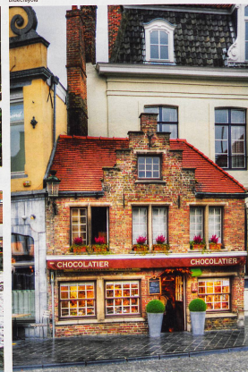
Les gourmands seront aussi gâtés. La Venise du Nord compte pas moins de 49 chocolateries.