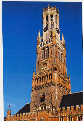
D'une hauteur de 83 mètres, le beffroi est accessible au public. Il suffit de monter ses 366 marches.