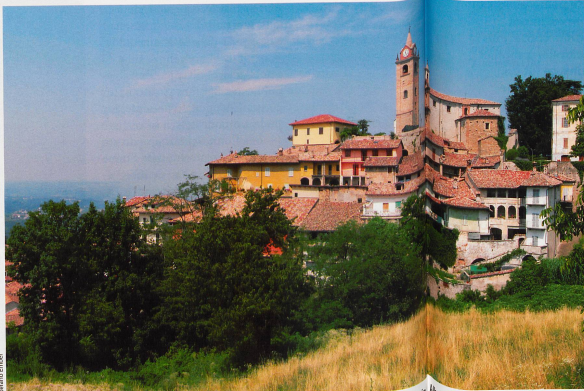
Considérée comme la capitale de la zone de collines des Langhe, à une quarantaine de kilomètres de Turin.

Au chapitre des records toujours, le prix de cet or blanc est monté jusqu'à 4000 euros le kilo en 2005 (soit quelque 6200 francs à l'époque), année où les caveurs (les chercheurs de truffe) ont connu une très mauvaise saison.