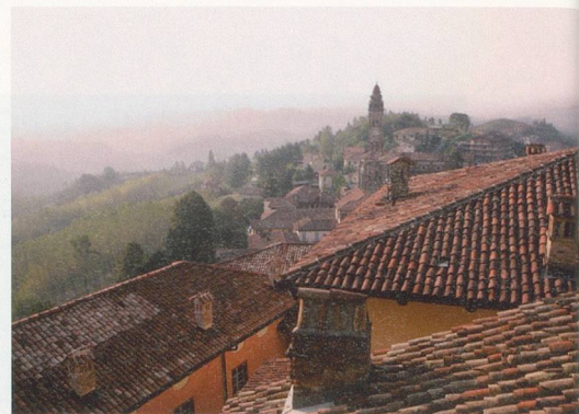
Les origines d'Alba datent d'avant la civilisation romaine, probablement liée à la présence des Celtes et des tribus ligures dans la région.

LUNDI 10 OCTOBRE Départ en direction d'Asti. Visite guidée de la vieille ville médiévale. Vous y verrez la Piazza Alfieri, l'église collégiale de San Secondo, etc. Puis, route vers le Monferrato où vous découvrirez des paysages pleins de charme et de douceur, des villages nichés sur les collines. Arrêt à Mombaruzzo. Visite d'une distillerie de grappa et dégustation. Dîner. Retour à Alba en passant