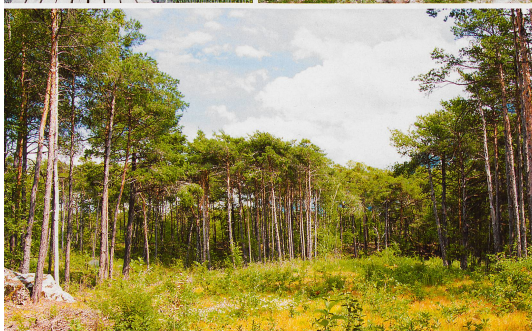
D'un pont bhoutanais long de 134 mètres aux pinèdes garantes de fraîcheur, le dépaysement est garanti dans ce coin du Valais.