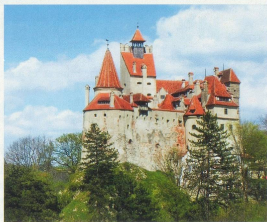
Même si aucun document historique ne l'atteste, le château de Bran est associé à Vlad Tepes et à Dracula, personnage qu'il a inspiré.

Vlad Tepes était connu pour faire subir le supplice du pal à ses ennemis, technique qu'il avait apprise en Turquie, où il avait été envoyé par son père en tant qu'otage entre 1442 et 1448! Cette période de captivité lui fera voir la vie (et la mort – la sienne interviendra en 1476 par décapitation) autrement. Il aurait ensuite tué des milliers de personnes par