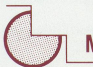
Lifts à siège