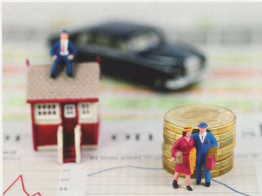
Dans certains cas, une prolongation peut être demandée et obtenue. A terme, le locataire est toutefois dans l'obligation de quitter.