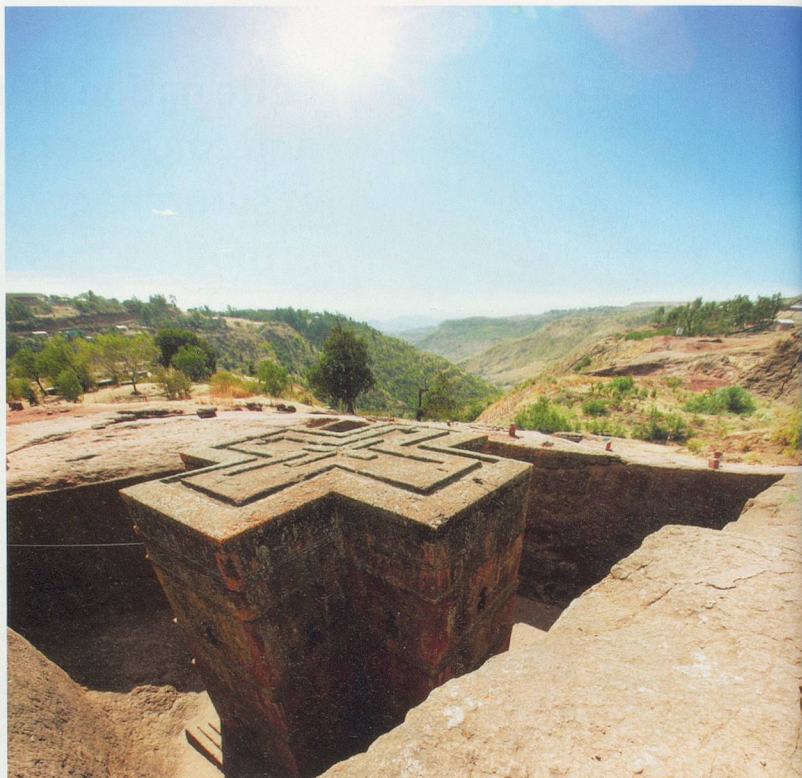
Une rencontre avec des adolescents dans les montagnes du Simien précèdera peut-être une visite sur le site de l'église Saint-Georges à Lalibela.