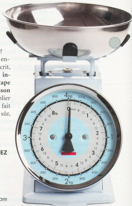
Shutterstock J. Hera