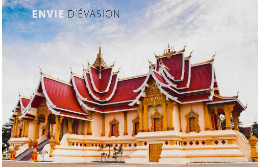
Le Laos regorge de trésors architecturaux, temples bouddhistes ou palais royaux. Luang Prabang est même un musée à l'air libre, classé depuis 1995 au Patrimoine mondial de l'humanité par l'UNESCO.