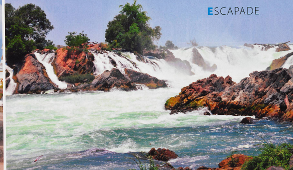
Les chutes du Mékong, à la frontière avec le Cambodge, ne sont pas hautes. Elles sont pourtant les plus larges du monde avec 14 kilomètres et cachent au sein de leurs flots une espèce de dauphin rarissime.

la monarchie. On y trouve notamment le Bouddha d'or (Pra Bang), l'icône la plus sacrée du Laos, qui a donné son nom à la ville. Il est haut de 83 cm pour 43 kg, et arbore une attitude dite «Ham Nhat» (apaisement des querelles). Dans ce musée, on en profitera aussi pour admirer la collection de bouddhas datant des XV e et XVI e siècles, de tambours de bronze et de diverses peintures. Le Mont Phouï lui fait face, de l'autre côté de la rue. Après avoir gravi les 328 marches, on atteint son sommet, recouvert du Vat Chomsi, un stupa haut de 20 mètres. La vue panoramique sur