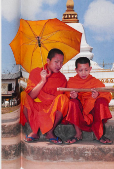
L'impressionnante majorité des Laotiens se fait moine au moins une fois dans sa vie. Une fonction passagère et temporaire.

Ce palais, jadis demeure des rois de Luang Prabang, a été transformé en musée national suite à la révolution de 1975 qui sonna le glas de