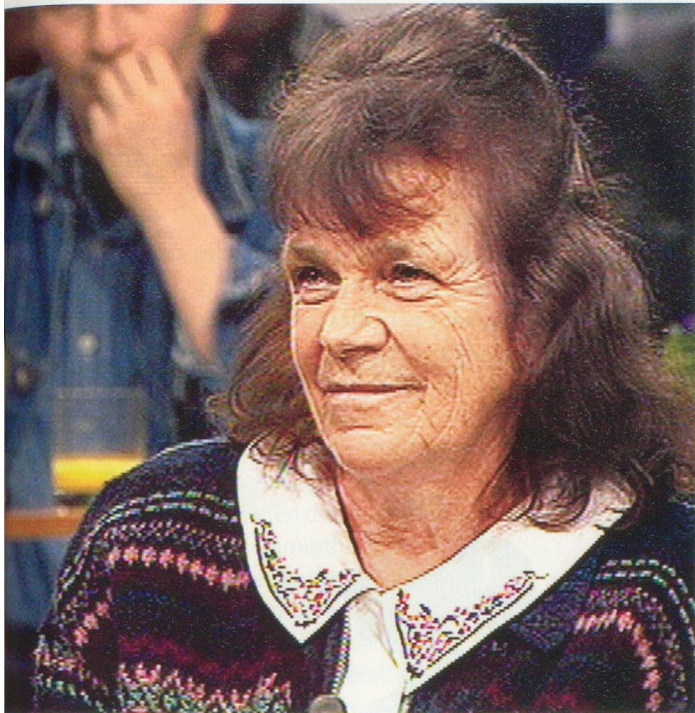
(plateau de Zig-Zag Café en 1998) sont restés honnêtes sur leurs joies