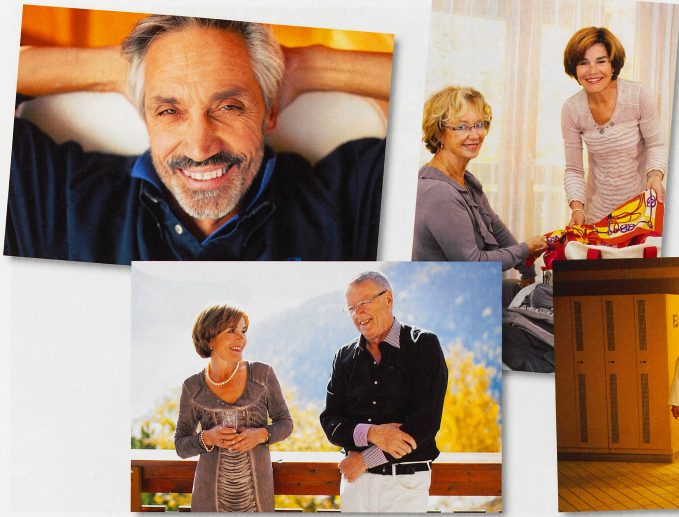
Entre deux séances de photos, les gagnants ont profité de se détendre, sous le soleil valaisan.