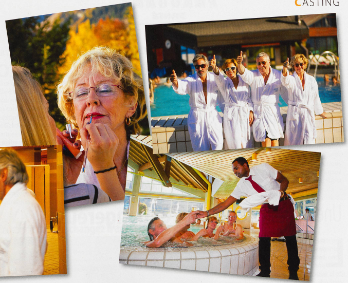
Changement de tenue et raccord maquillage: les stars du jour se sont montrées très professionnelles.