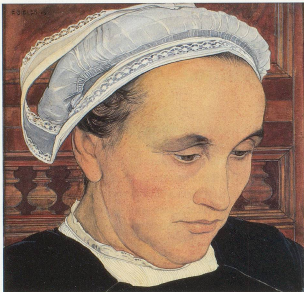
VALAISANNE AVEC COIFFE DE DENTELLES, 1909 Aquarelle et gouache sur papier, 25 x 25 cm Collection particulière