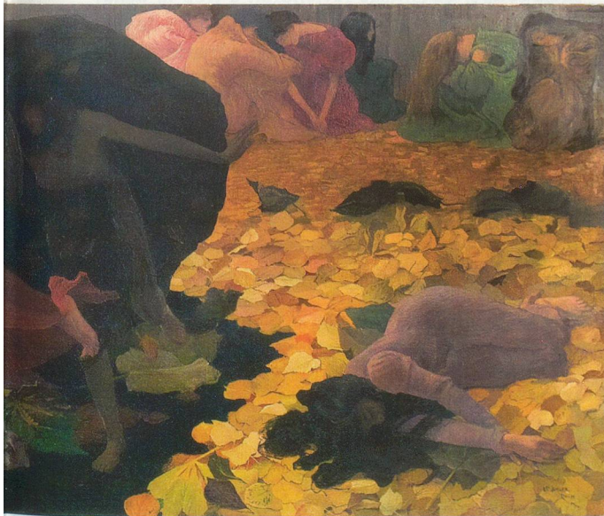
LES FEUILLES MORTES, 1899 Huile sur toile, 149,7 x 481,5 cm Kunstmuseum Bern

La quête de Biéler des traditions et des racines trouve particulièrement son expression dans les représentations de la vie quotidienne où les détails deviennent des éléments décoratifs. Dans ce type d'œuvres, Biéler accorde aux costumes traditionnels une signification particulière et ils accèdent, au travers de ses mises en scène, à une imposante solennité.