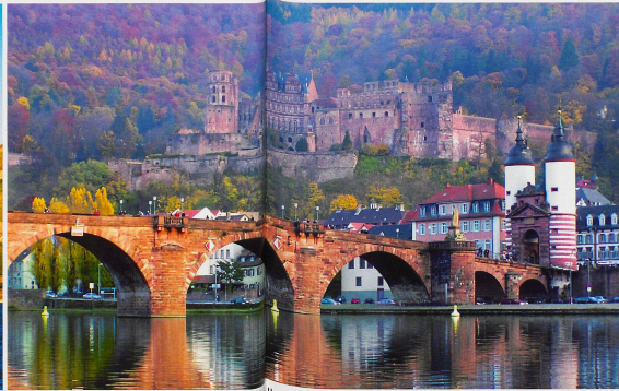
Impossible de ne pas la prendre en photo. La forteresse Heidelberg (1398-1410) est devenue au fil des siècles une majestueuse demeure surplombant la rivière Neckar.

sons anciennes, ses deux églises gothiques, le château de Schönburg, parfaitement restauré après avoir été détruit par les Français – comme beaucoup de ses voisins – en 1689. Son impressionnante façade rougeâtre fait son effet.