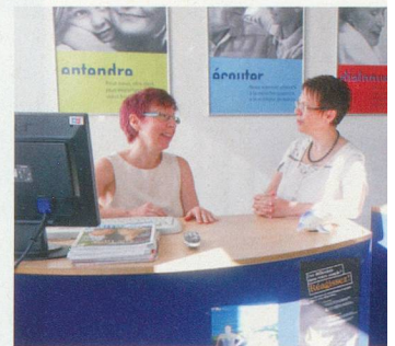
Notre équipe de 15 Audioprothésistes diplômés vous assiste sur toutes les questions concernant votre audition.

Nos consultations auditives professionnelles commencent par un test auditif gratuit et un entretien sans engagement. Le client est le centre de nos préoccupations. Nos locaux clairs et leurs aménagements modernes ne laissent rien à désirer. Nos 15 points de vente se situent toujours en plein cœur de la ville dans tous les cantons romands, accessibles très facilement en voiture, à pied ou par les transports en commun. Votre visite sera toujours la bienvenue.