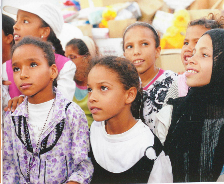
des produits de base: le Trophée a distribué 15 tonnes de matériel en 2010 et 21 tonnes l'an passé. donnent des consultations gratuites au fil des étapes.