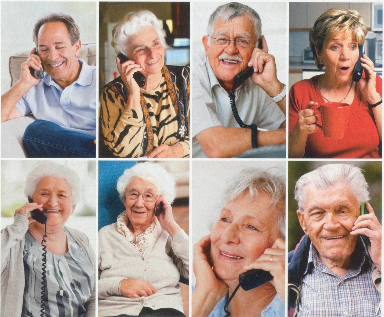
Monkey Business Images, Mikhail Tchkeidze, Yuri Arcurs, Bryan Sikora, Tyler Olson

Ce concept développé par Pro Senectute consiste à appeler régulièrement un autre aîné. En faisant partie ainsi d'un petit réseau de quelques personnes, cette ligne de solidarité permet d'éviter l'isolement social.