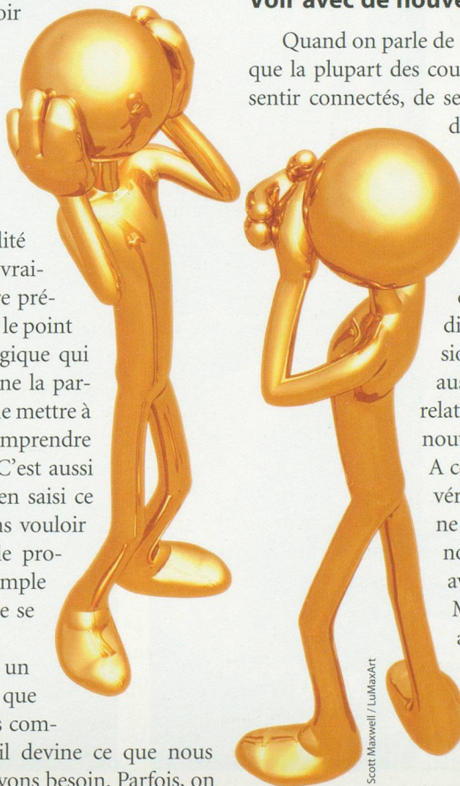
Scott Maxwell / LuMaxArt

Quand on parle de «mieux communiquer» – ce que la plupart des couples cherchent – c'est de se sentir connectés, de sentir que l'autre est curieux de nous. Il existe aujourd'hui beaucoup d'activités destinées aux couples qui souhaitent cultiver leur relation. On apprend généralement à utiliser des outils pour améliorer le dialogue, dissoudre les tensions, explorer le passé, mais aussi nourrir le positif dans la relation et se voir avec un regard nouveau, ce qui est primordial. A ce sujet, Proust disait que «le véritable voyage de découverte ne consiste pas à chercher de nouveaux paysages, mais à avoir de nouveaux yeux». Mieux communiquer, c'est avant tout avoir implicitement ou explicitement une attitude qui dit «laisse-moi te découvrir et me découvrir avec curiosité».