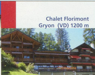
Chalet Florimont Gryon (VD) 1200 m