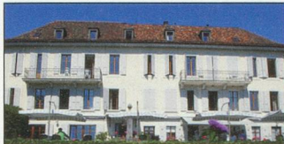
Nouvelle Roseraie St-Légier (VD) 480 m

Région Avenches, 1587 Constantine, Vully VD Tél. 026 677 13 18 – www.chateauconstantine.com