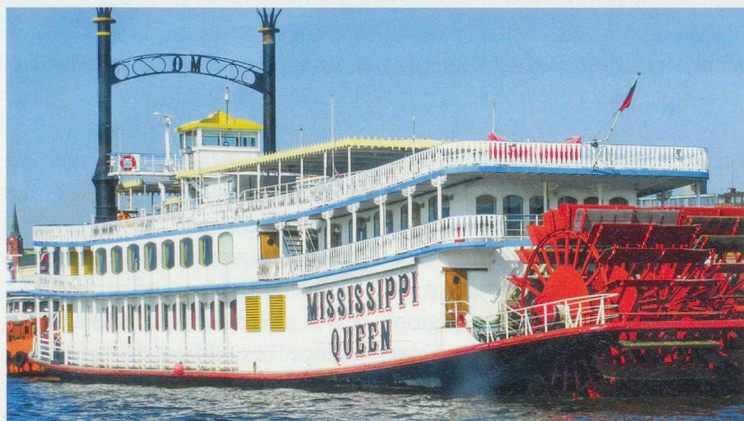
Un bateau à aubes, le Mississippi... il n'en faut pas plus pour plonger dans les souvenirs des aventures de Tom Sawyer et Huckleberry Finn.

La Nouvelle-Orléans se quitte en chanson. Direction Bâton-Rouge, capitale de Louisiane. En route, des plantations de canne à sucre ou de coton, comme celle que possédait la famille de Scarlett O'Hara, se succèdent, rappelant aussi les heures sombres. La bâtisse de style néo-grec de