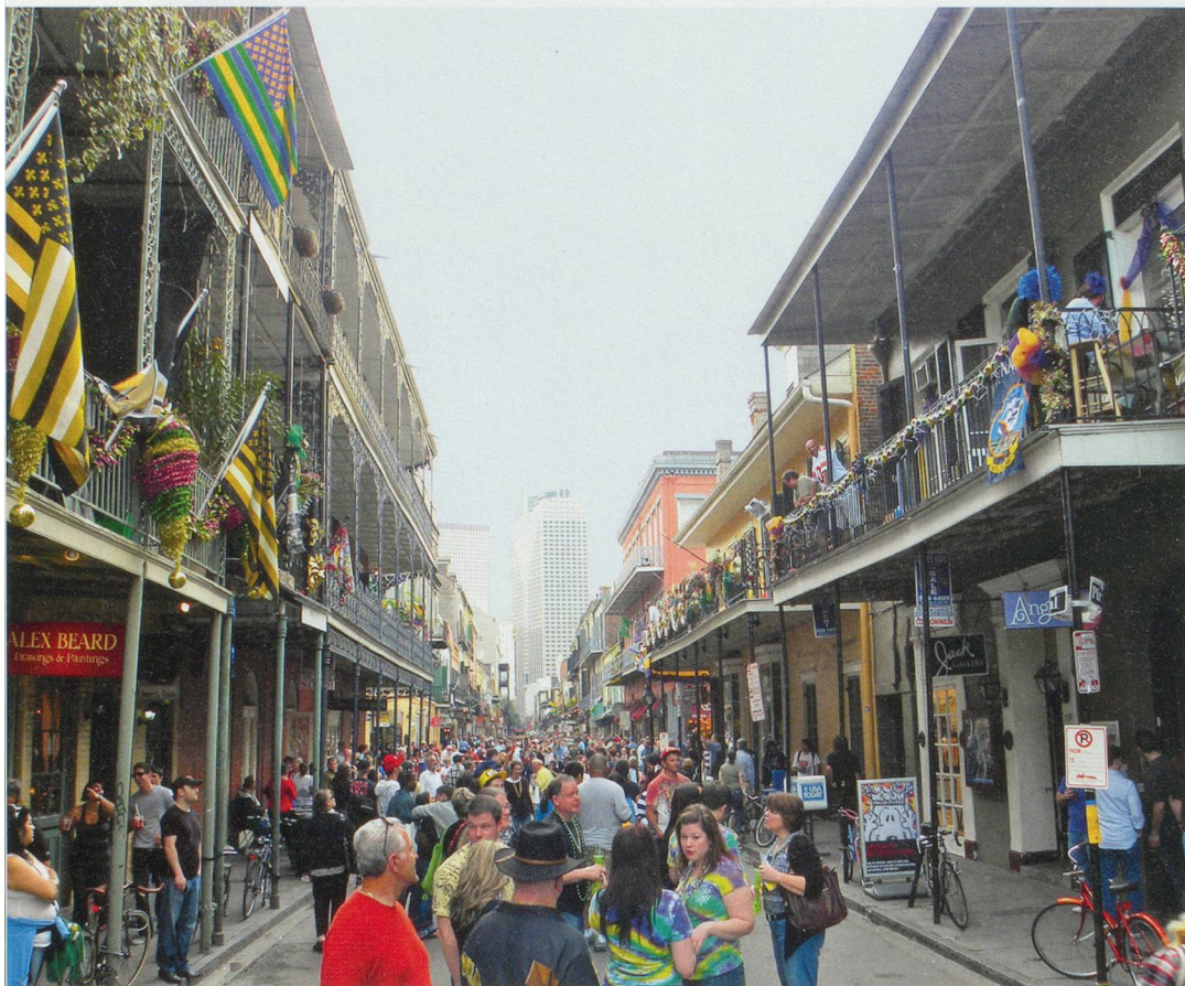
Le Vieux-Carré de La Nouvelle-Orléans est composé de rues étroites bordées de petits édifices coloniaux.

noctambules, qui s'y amusent et boivent jusqu'au bout de la nuit. Une bonne façon de se préparer pour le Mardi gras, l'événement de l'année, où les chars et les cortèges défilent dans une débauche de couleurs.