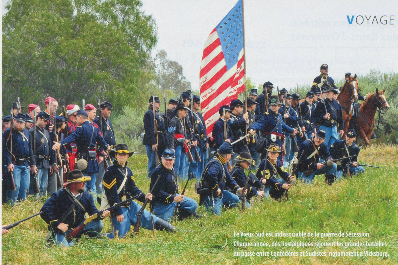
Le Vieux Sud est indissociable de la guerre de Sécession. Chaque année, des nostalgiques rejouent les grandes batailles du passé entre Confédérés et Sudistes, notamment à Vicksburg.