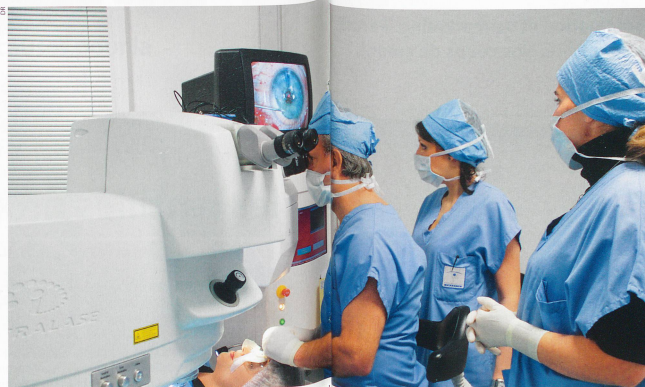
Rapide et sûre, l'opération au laser de la presbytie, appelée Presbylasik, ne dure qu'une trentaine de secondes par œil et peut être réalisée en une seule fois. Après l'opération, la vision de loin se situe entre 60% et 80% selon les patients, mais elle s'améliorera au fil des semaines suivantes, jusqu'à récupération complète.

LES NOUVEAUTÉS (OU PRESQUE): la pose d'implants multifocaux s'adresse aux individus âgés de plus de 55 ans ayant une presbytie plus évoluée. Actuellement, les implants intraoculaires multifocaux