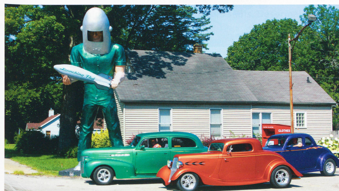
Sur certaines sections de cet interminable ruban reliant Chicago à Los Angeles, des associations se sont battues pour restaurer et maintenir en état les enseignes géantes des restaurants et magasins, ces symboles d'une époque révolue qui font le bonheur aujourd'hui des motards et autres conducteurs nostalgiques.

date de son déclassement au profit de l'autoroute. Mais cette artère mythique reliant Chicago à Los Angeles fait encore rêver des millions de gens. Redécouvrez-la en ouverture de la saison 2012-2013 d'Exploration du monde.