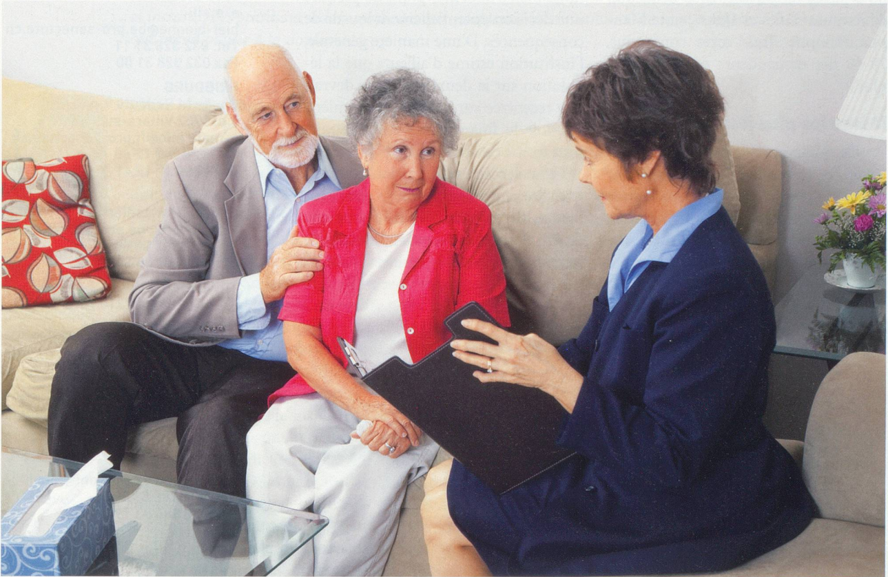
Lisa F. Young

La consultation sociale de Pro Senectute est sollicitée sans répit pour des informations, des conseils du soutien et des aides financières pour faire face à des situations sociales individuelles complexes.