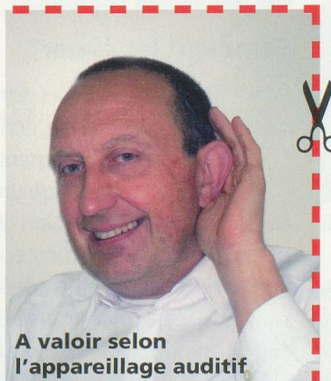
A valoir selon l'appareillage auditif