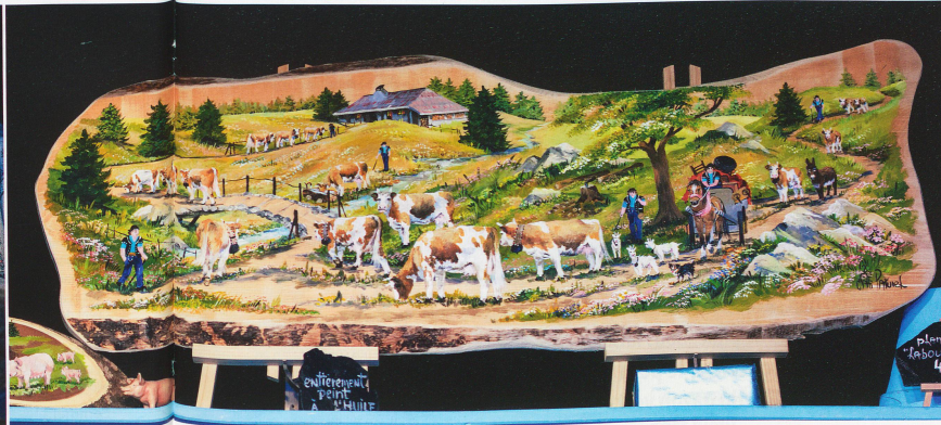
le plus grand plaisir des amateurs qui s'arrachent ses œuvres.