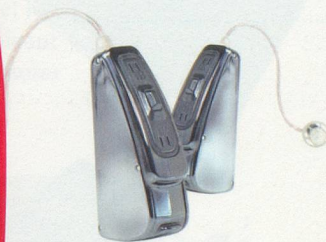
PHONAK AUDEO S SMART IX CERAMIC

LAUSANNE ECUBLENS GENÈVE NEUCHÂTEL MARTIGNY NYON