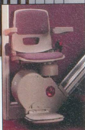
Lifts à siège