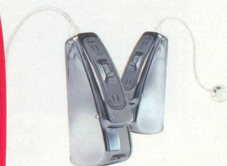
PHONAK AUDEO S SMART IX CERAMIC

LAUSANNE ECUBLENS GENÈVE NEUCHÂTEL MARTIGNY NYON