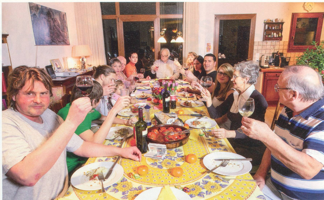
Le repas de famille, un moment important pour les Dormond. Pas de chichis, mais le plaisir d'être ensemble pour se raconter les bons moments de la vie.

moment où l'on se retrouve tous ensemble. Et en plus, on mange bien!»