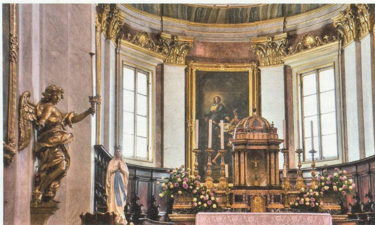
La cathédrale San Rufino est consacrée au saint du même nom, qui fut le premier évêque de la ville. C'est aussi un lieu rempli d'histoire, puisque c'est ici que sainte Claire et saint François ont été baptisés.