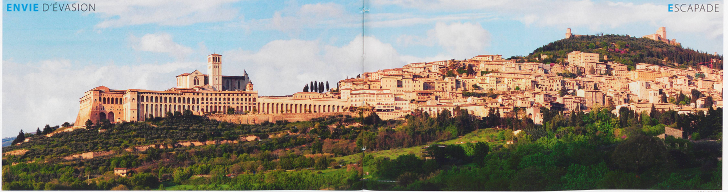
Située dans la province de Pérouse, Assise est surtout célèbre pour son apogée à l'époque médiévale et pour être le lieu de naissance et de mort de Francesco Bernardone, devenu l'un des Évangélistes et le respect de la Création.