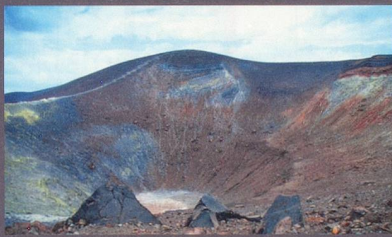
Randonnées guidées par Jean-Pierre Wagnières