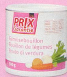
Bouillon de légumes Prix Garantie, 500 g (100 g = -.79) 3.95