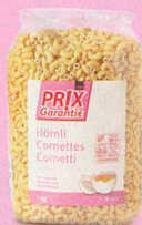
Cornettes Prix Garantie, 1 kg (100 g = -.17) 1.70