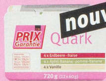
nouveau Préparation à base de séré fraise/pomme-banane/vanille Prix Garantie, 12 x 60 g (100 g = -.39) 2.75