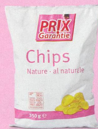
Chips nature Prix Garantie, 350 g (100 g = 1.05) 3.70