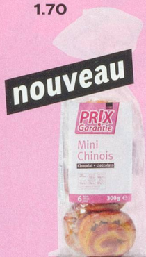
nouveau Mini-chinois au chocolat Prix Garantie, 300 g (100 g = -.93) 2.80