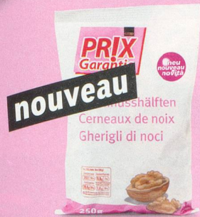
nouveau Cerceaux de noix Prix Garantie, 250 g (100 g = 1.68) 4.20

Déjà plus de 400 produits «prix bas garanti»!