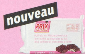
nouveau Galettes de riz enrobées de chocolat au lait Prix Garantie, 250 g (100 g = -.98) 1.95