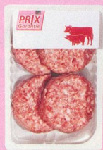
Galettes de viande hachée Prix Garantie, Suisse, en libre-service, 4 x 150 g (100 g = 1.37) 8.20