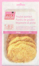
Panés de poulet Prix Garantie en libre-service, 500 g (100 g = 1.35) 6.75