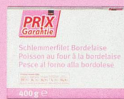
Poisson au four à la bordelaise Prix Garantie, 400 g (100 g = -.70) 2.80