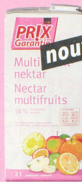
nouveau Nectar multifruits Prix Garantie, 2 litres (1 litre = -.87) 1.75