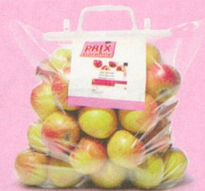
Pommes Prix Garantie, Suisse, le cabas de 2.5 kg (1 kg = 1.40) 3.50