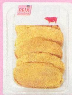
Escalopes de porc panées Prix Garantie, Suisse, en libre-service, env. 600 g 1.85 les 100 g