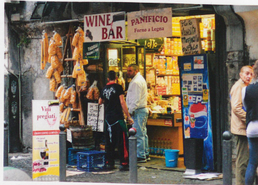
La vente des santons, une aubaine pour certains habitants de Naples qui subissent eux aussi la crise économique.