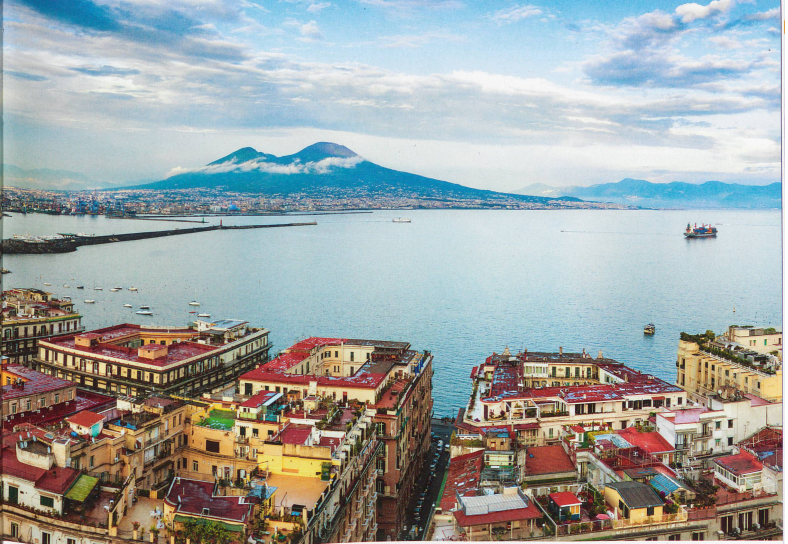
Ombre parfois menaçante, le Vésuve veille sur la ville de Naples et pique parfois de grosses colères. Dans les rues, les exubérantes scènes de la vie napolitaine ne manquent