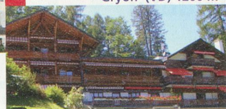
Chalet Florimont Gryon (VD) 1200 m