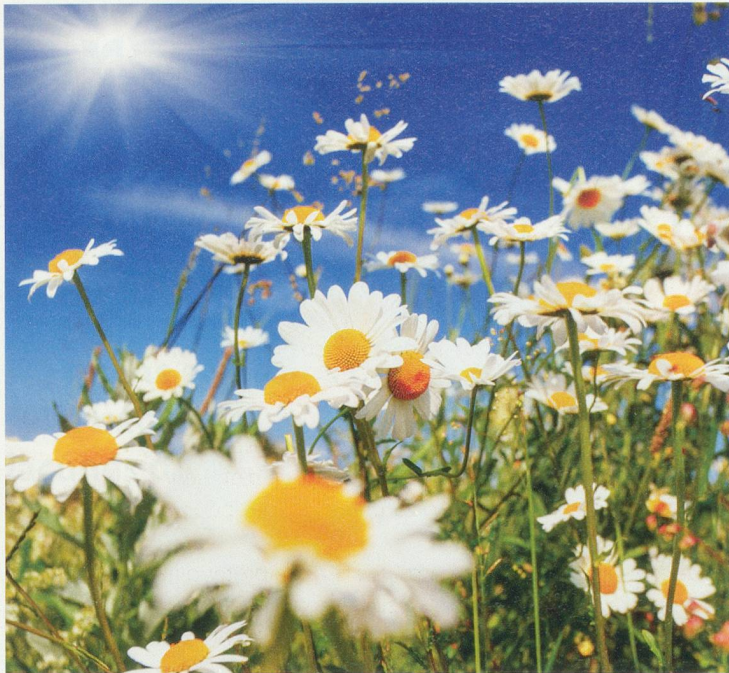
Creative Travel Projects