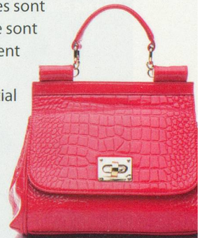
M. Unal Ozmen

O n le sait: les poignées de caddies sont un nid à bactéries. Mais elles ne sont pas les seules. Les sacs à main peuvent aussi se transformer en foyers de germes. Selon Peter Barratt, de l'Initial Washroom Hygiene au Royaume-Uni, un sac sur cinq (surtout en cuir) contiendrait des bactéries nocives, dues aux tubes de crème pour les mains, de rouge à lèvres et de mascara mal fermés.