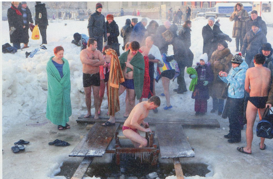
Saint-Petersbourg, un charme onirique singulier qui se cristallise dans les rues et les places de cette Venise du Nord, bercée parfois par un vent glacial.

D rapée dans sa toge hivernale, Saint-Petersbourg se pare de magie. La dentelle blanche des flocons de neige finement ciselés, qui habille les arbres et les grilles en fer forgé, lui offre un petit supplément d'âme. Un charme onirique singulier, qui se cristallise dans les rues de cette Venise du Nord, posée sur le delta de la Neva. Ses quelque 250 musées et 4000 monuments, remarquables et remarqués, font concurrence aux plus belles villes européennes. D'ailleurs, seule la Cité des Doges annonce davantage d'édifices classés au Patrimoine mondial de l'UNESCO! La comparaison aurait sans conteste ravi son fondateur,