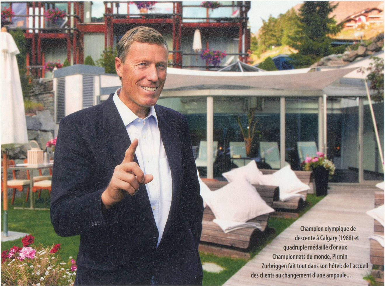
Champion olympique de descente à Calgary (1988) et quadruple médaillé d'or aux Championnats du monde, Pirmin Zurbriggen fait tout dans son hôtel: de l'accueil des clients au changement d'une ampoule...