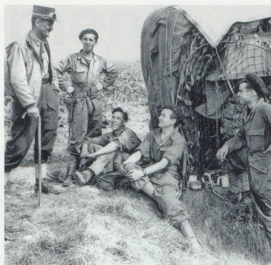
Le général Leclerc (à g.) avec l'équipage d'un char alors encore en Normandie.

«La ville n'avait plus aucune signification tactique. En dépit de sa gloire historique, Paris ne représentait qu'une tache d'encre sur nos cartes; il fallait l'éviter dans notre marche vers le Rhin.» Les Mémoires du général américain Bradley attestent que la Libération de Paris, de surcroît trop coûteuse en vivres, n'était pas une priorité, contrairement au bassin de la Ruhr, où se trouvait l'industrie lourde allemande. Les 4 millions de Parisiens étaient donc supposés prendre leur mal en patience jusqu'à fin octobre. Enjeu de second rang pour le général Eisenhower, commandant en chef des forces alliées en Europe, mais prioritaire pour le général de Gaulle, la Libération de Paris viendra de l'intérieur. Le 19 août, tant le Gouvernement provisoire de la République française, le Conseil national de la résistance, le Parti communiste, le commandement régional que le Comité parisien de libération appellent les Parisiens à se soulever, qui répondent aussitôt à cette demande. Trois jours plus tard, le général Leclerc reçoit l'autorisation du commandement militaire