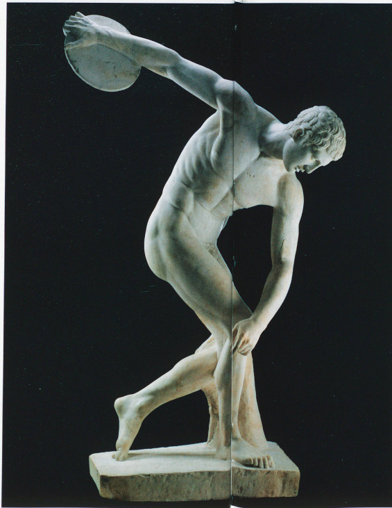
Le discobole, marbre

La beauté du corps dans l'Antiquité grecque, Fondation Gianadda à Martigny, du 21 février au 9 juin 2014, tous les jours de 10 h à 18 h. www.gianadda.ch