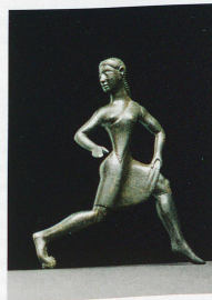
Une femme athlète?

Cette statuette pourrait provenir de Sparte, où les femmes, à la différence des autres villes de Grèce, prenaient part aux jeux du stade. Des athlètes féminines s'affrontaient aussi lors de la course à pied des jeux héréens, à Olympie. Bronze, jeune femme courante, Grèce, probablement réalisée en Laconie, VI e siècle av. J.-C., réputée provenir de Prizren (Kosovo).