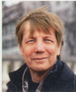
Wollodja Jentsch, photographe