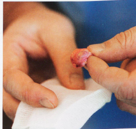
L'ovaire, dont l'extraction est l'aspect le plus délicat de l'opération, mesure un centimètre, pas davantage! «La stérilisation précoce, en particulier des bouledogues, réduit les risques de cancer des mamelles», précise le vétérinaire.