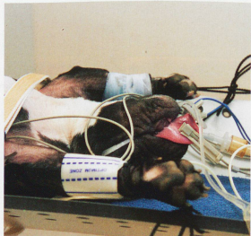
Endormie et sous le contrôle d'un monitoring, la chienne est attachée sur la table d'opération, la langue maintenue à l'extérieur. «Il s'agit d'éviter que Zylva ne tombe, commente le vétérinaire, car cette table est basculante.»