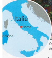
Carloforte est l'unique centre urbain de l'île San Pietro, rattachée à l'archipel des Sulcis au sud-ouest de la Sardaigne.