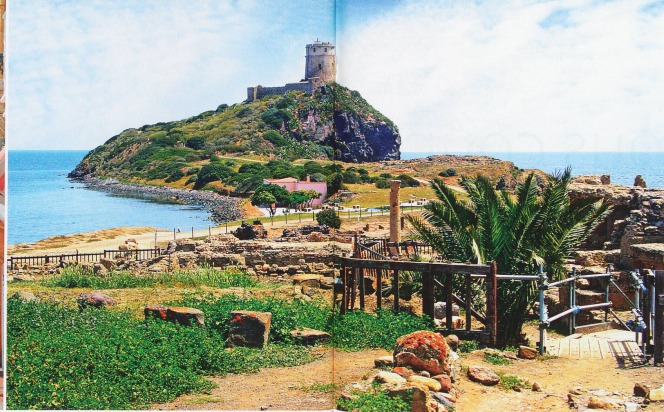
Nora est une ancienne cité pré-romaine et romaine située sur la péninsule de Capo di Pula, près de Cagliari en Sardaigne. La tradition en fait la première cité fondée sur cette île par les Phéniciens au IX e -VIII e siècle av. J.-C. La stèle de Nora est réputée être le plus ancien document écrit européen.

et de ses centres d'intérêt lors d'une excursion d'un jour. Au sein de ces panoramas exceptionnels se défilent d'impressionnantes falaises, de profondes grottes et d'imposants pinacles. La marche est rythmée par le ressac de la mer, bercée par les subtiles fragrances du maquis: lavande, thym, myrte, etc. Un bonheur simple, mais tellement agréable! Comment résister à ces petites criques célestes de sable fin, blotties à l'abri de parois vertigineuses et déchiquetées qui tombent abruptement dans des flots turquoise presque irrésistibles? Finalement, pourquoi ne pas s'y arrêter afin de faire une siesta , coutume locale, ou pour y piquer une tête? Dans tous les cas, on ne manquera sous aucun prétexte la plus exceptionnelle de toutes: Cala Goloritzé, l'une des rares plages à avoir été classée au Patrimoine mondial de l'UNESCO. C'est dire!