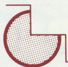
Lifts à siège