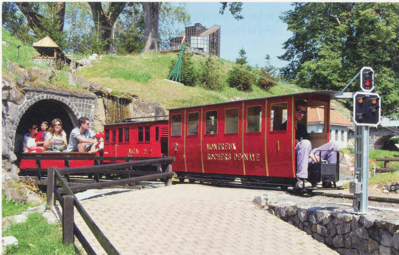
Petits et grands s'amuse avec les trains miniatures du Bouveret.