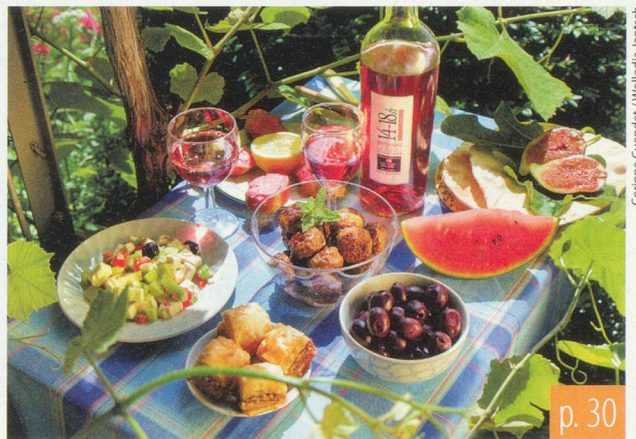
Corinne Cuendet / Wolledja Jentsch